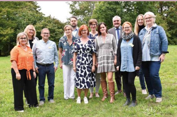
Der Arbeitskreis AIDS / STI Rheinland-Pfalz Nord